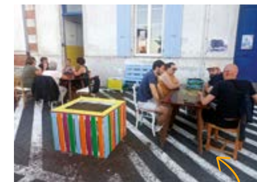
La soirée jeux de début juillet